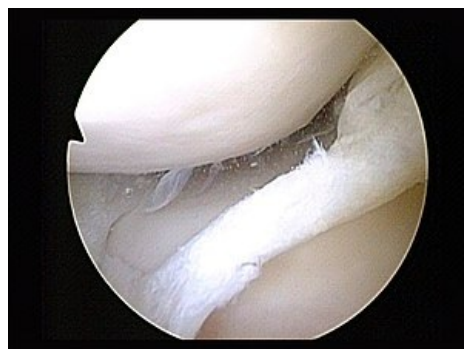
Ruptura mediálního menisku