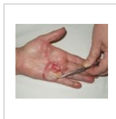
obr. 4 Kontaktní popálení IIa-b st. Po odstranění precipitovaného fibrinu, je možno kryt vrátit na popálenou plochu