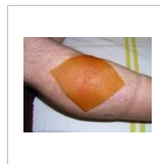
obr. 5 Antiseptický kryt Inadine