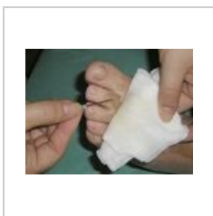
obr. 1 Perforace serózní buly sterilní jehlou

Velký důraz je kladen na ošetření popálených rukou a obličeje, hlavně pak u pacientů, kteří odcházejí po ošetření domů a budou dále léčení ambulantně. (obr. 7).