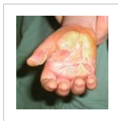
obr. 3 Stav po otevření a vypuštění bul, epidermis ponechána na ploše jako dočasný biologický kryt