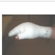
obr. 7 Správně modelovaný obvaz popálené ruky, palec je separován od ostatních prstů.