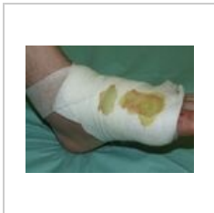
obr. 6 Prosáklý obvaz a modrozelené zbarvení napovídá, že plocha je infikována Pseudomonas aeruginosa .