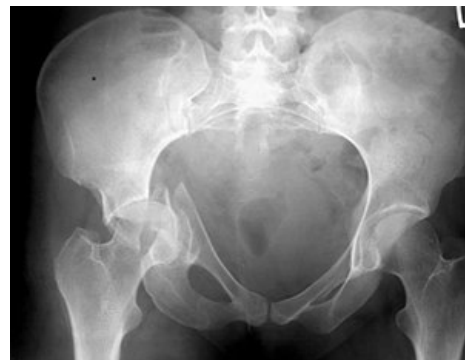
Kombinovaná fraktura pánve s centrálně luxovanou frakturou acetabula