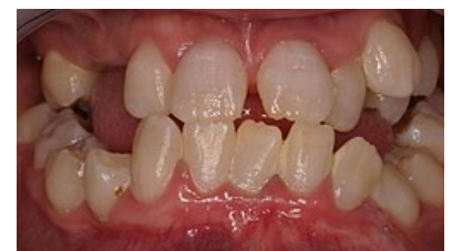
Dysplazie dentinu 1. typu