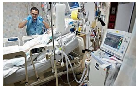
Pacient na UPV na oddělení intenzivní péče