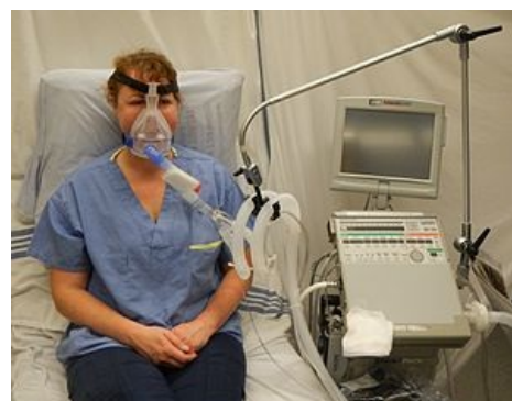
Neinvazivní přetlaková plicní ventilace (NPPV, NIV)