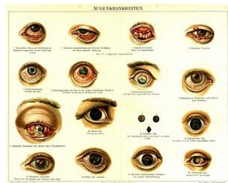
Tablo očních patologií