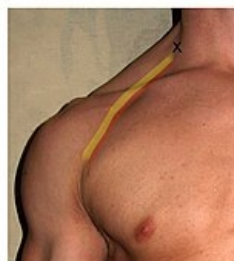
Útlak mezi musculi scaleni

Medscape 96412 ( https://emedicine.medscape.com/article/96412-overview )