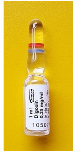
ampule 0,25mg digoxinu