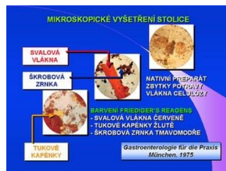
Mikroskopické vyšetření stolice

která může být aktivována graviditou a přináší zvýšené riziko malignit gastrointestinálního traktu, je možný detekcí sekrečních IgA protilátek ke gliadinu nebo průkazem protilátek ke tkáňové transglutamináze ve stolici.