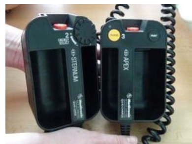
Vzhled pádel k defibrilaci