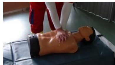
Poloha rukou při KPR