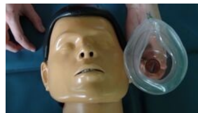
Vhodná velikost masky