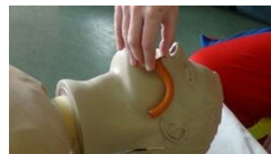
Jak zvolit vhodnou velikost