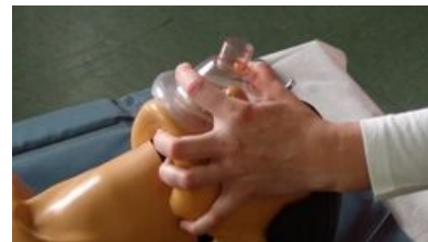
Jak držet masku k ambuvaku