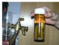
Pivo: nadměrná konzumace alkoholu