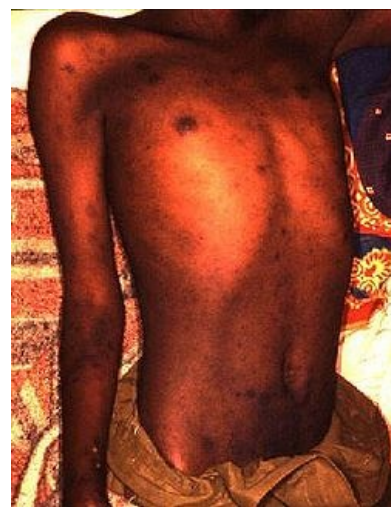
Typická tyfová vyrážka