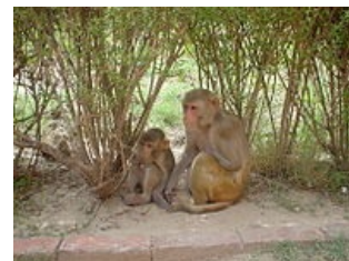
Makak rhesus ( Macaca mulatta ) – právě tento druh je spojen s objevem Rh faktoru (Rhesus faktor)