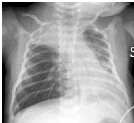
Virová pneumonie u novorozence vyvolaná RSV