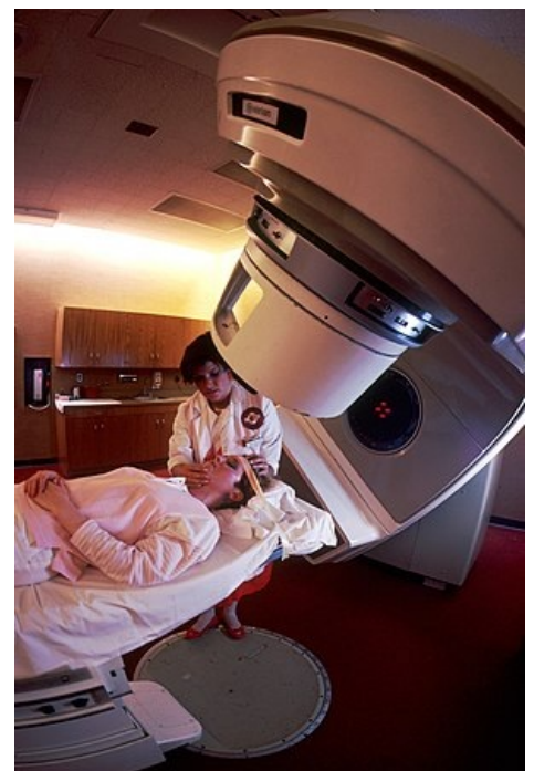
Žena připravena podstoupit radioterapii

Konformní radioterapie , resp. trojrozměrná konformní radioterapie, dnes patří k moderně vedené léčbě radioaktivním zářením. Cílem je individuálně přizpůsobit ozařovaný objem nepravidelnému trojrozměrnému tvaru cílového objemu nádorového ložiska. Ozařuje se cílový objem s minimálním lemem a s menším zatížením zdravých tkání.