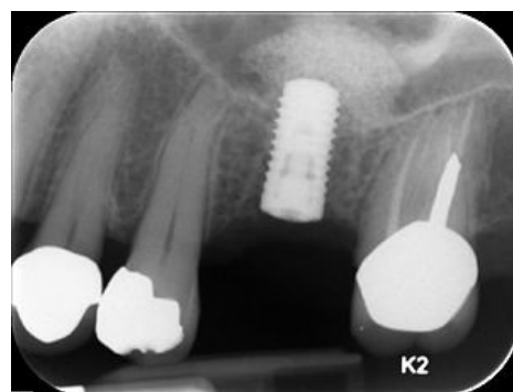
Dentální implantát (RTG)