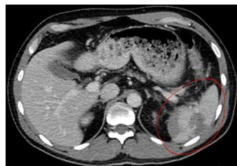
CT úrazové ruptury sleziny