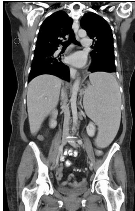
Splenomegálie u CLL