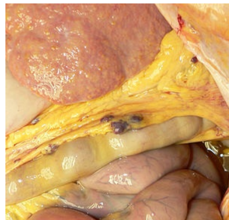
Tmavěčervené uzlíky jsou implantovanou slezinnou tkáně po splenektomii z důvodu úrazové ruptury sleziny