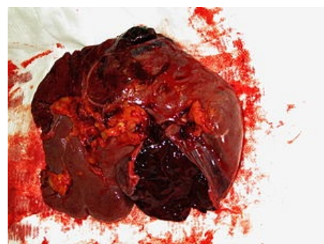
Slezina po splenektomii. Dvoudobá ruptura se subkapsulárním hematodem