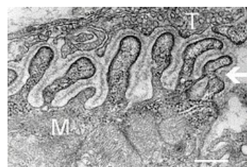
Nervosvalová ploténka v elektronovém mikroskopu; T – terminální axonové zakončení, M – svalové vlákno