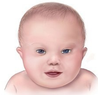
Dítě s Downovým syndromem