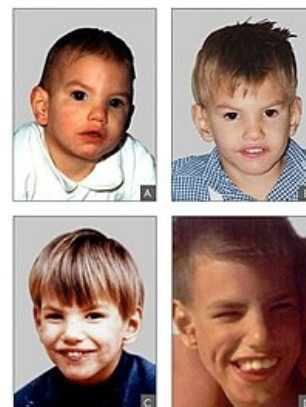
Syndrom Cri du chat