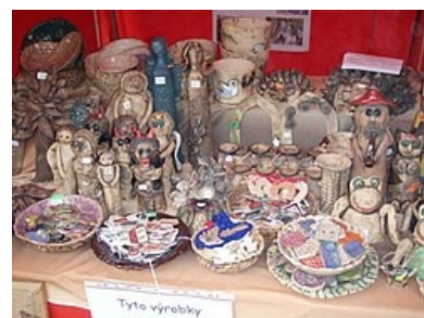
Keramika z chráněné dílny

Prostředí nemůže ovlivnit mentální retardaci jako takovou, ale velmi významně ovlivňuje emoční a sociální vospívání retardovaných dětí. Rozdíl mezi dětmi vyrůstajícími v podporující rodině a dětmi z celoročních ústavů je tak velmi zřetelný.