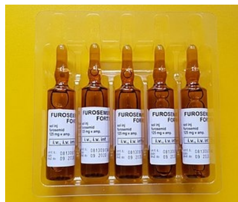
Ampule 125mg furosemidu