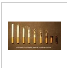
Antismoking23.jpg 500 × 266; 68 KB