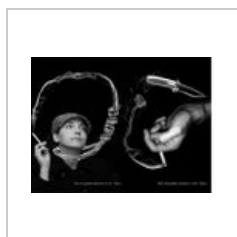
Antismoking.jpg 500 × 365; 46 KB

The following 5 files are in this category, out of 5 total.