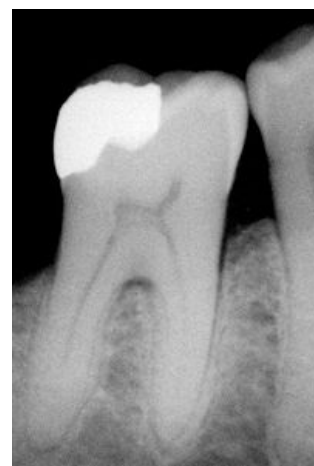
Amalgámová plomba na RTG snímku, která může sloužit při identifikaci neznámého zemřelého

Identita bezpečně prokázána – identita nelze vyloučit – identita vyloučena.