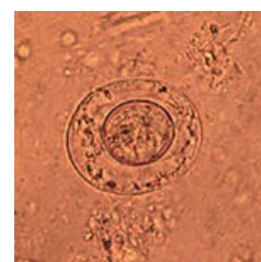
Vaiíčko H. nana