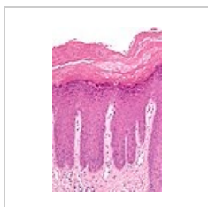
Lichen ruber chronicus – přítomna akantóza, hyperkeratóza, parakeratóza, spongióza