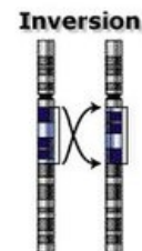
Inverze části chromozomu