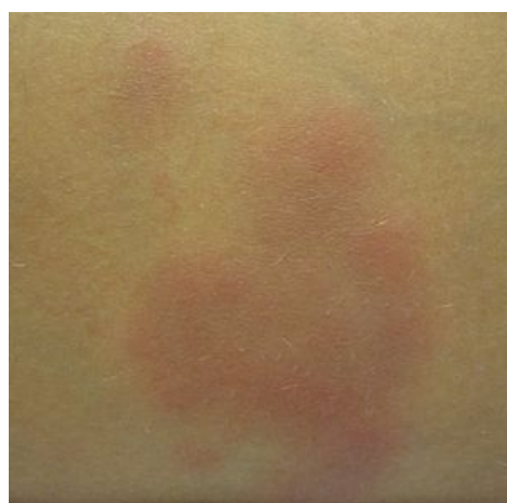
Erythema nodosum - jednotlivá léze