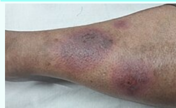
erythema nodosum asociovaná se systémovým lupus erythematosus