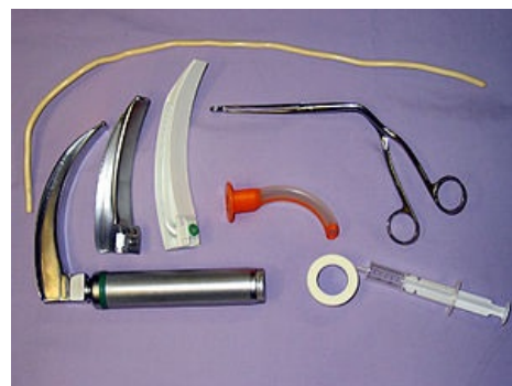
Prostředky pro intubaci