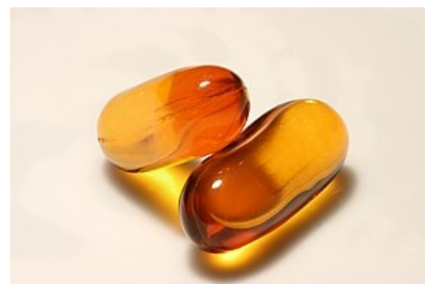
Rybí olej – zdroj Omega-3 mastných kyselin

Uvádí se inhibiční efekt omega-3 mastných kyselin v rybím oleji na imunitní funkce – snížení produkce leukotrienů. Využití v léčbě autoimunitních onemocnění je stále pokládáno za sporné; sporný je v této oblasti i efekt omega-6 mastných kyselin a mononenasycených kyselin z olivového oleje. Štěpení kyseliny arachidonové může působit prozánětlivě.