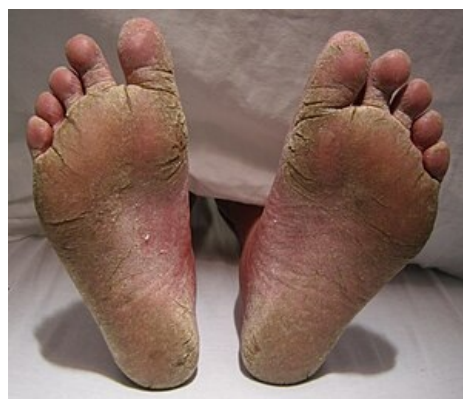
Těžká forma tinea pedis