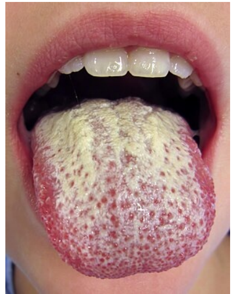
Orální kandidóza po léčbě antibiotiky

Podrobnější informace naleznete na stránce Candidosis.