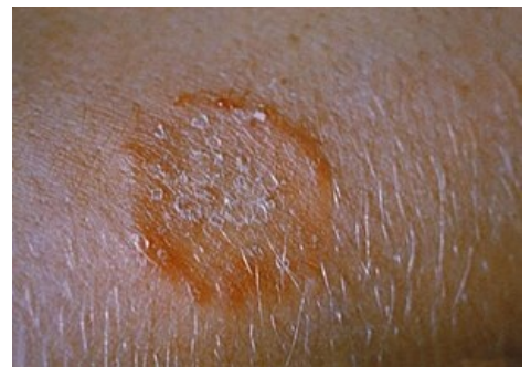
Tinea corporis způsobená Trichophyton mentagrophytes