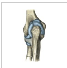
Kloubní pouzdro loketního kloubu – pohled zezadu