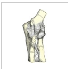
Articulatio cubiti zepředu