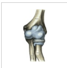
Kloubní pouzdro loketního kloubu – pohled zepředu