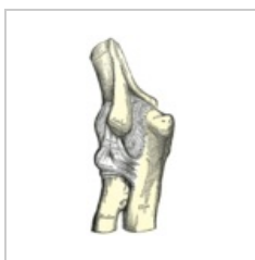
Articulatio cubiti zezadu