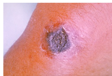
Kožní forma antraxu.