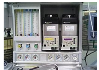
Rotametry a odpařovače prchavých anestetik.