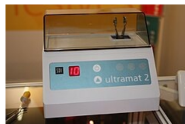
Třepačka na amalgám.

Dříve se amalgám připravoval v amalgamátoru (v poměru 1:1,1 (prášek : rtuť) při otáčkách 1800–6600 za minutu), dnes je možné použít pouze kapslovaný amalgám, který je promícháván v třepačce na amalgám. Správně namíchaný amalgám by měl mít konzistenci marcipánu. Nadbytek rtuti vede ke snížení mechanické a chemické odolnosti a vysoké konečné expanzi. Nedostatek rtuti vede ke snížení odolnosti v tlaku a proti korozi.