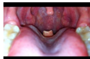
Viditelná epiglottis u akutní epiglottitidy