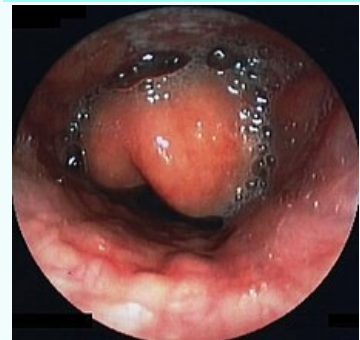
Endoskopický obraz epiglottitidy