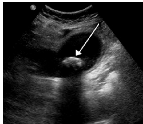
Cholelithiáza v USG obraze