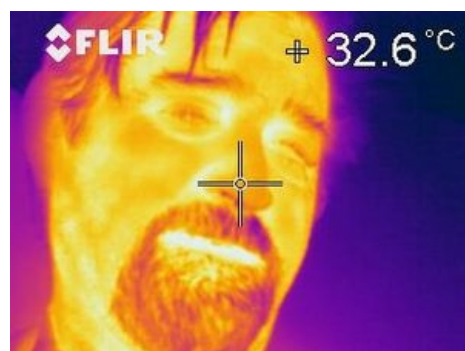
Povrch tváře snímáný termokamerou

Bezkontaktní měřiče teploty fungují na principu fotoemise dopadajícího elektromagnetického záření na snímací prvek, který toto záření přemění ve zvoleném frekvenčním spektru na elektrický signál. Tento signál je dále zpracován a výstupovou informací je zobrazení normálního tvaru tělesa s přiřazenými barvami na displeji. Barvy odpovídají určitým teplotám podle barevné škály.