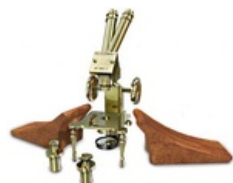
Historický stereomikroskop používaný na začátku 20. století