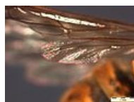
Vespula vulgaris Stereo Microscope křídlo 2