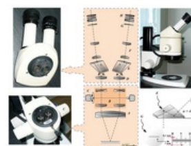
Stavba moderního stereomikroskopu. A – objektiv, B – Galileův teleskop, C – ovládání přiblížení, D – interní objektiv, E – krystal, F – přenosná čočka, G – síť, H – okulár.

Lidské oko a mozek fungují dohromady a vytvářejí tzv. stereoskopické vidění, díky kterému vidíme prostorové trojrozměrné obrazy. Tento dojem vytváří mozek při zpracování dvou, lehce odlišných obrazů z obou sítnic. Lidské oči jsou od sebe vzdáleny přibližně 6,5 cm, a proto každé oko vidí daný předmět pod lehce odlišným úhlem. Až po přenesení do mozku jsou oba obrazy sloučeny a vytvářejí výsledný trojrozměrný obraz předmětu. Tato funkce je ideální pro zkoumání povrchů pevných materiálů. Od ostatních mikroskopů se stereomikroskop liší i osvětlením. Využívá horního světla, jehož paprsky se odráží od povrchu vzorku. To umožňuje ideální pozorování silných nebo neprůhledných materiálů.