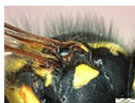
Vespula vulgaris Stereo Microscope křídlo 1