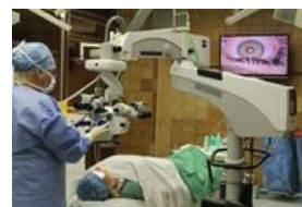
Operace oka s využitím stereomikroskopu

Díky svému konstrukčnímu uspořádání se stereomikroskopy využívají v biologii, botanice, entomologii a jiných přírodních oborech. Důležitý význam mají i v medicíně, kde jsou využívány např. v mikrochirurgii. Umožňují přesnou představu o trojrozměrném vzhledu tkáně a okolních struktur. Přístroje s delší pracovní vzdáleností se využívají v průmyslu pro montáž a kontrolu výrobků, povrchu materiálu a dále např. ve zlatnictví a hodinářství. Stereomikroskopy mají své využití i při studiu povrchu pevných vzorků např. v geologii.