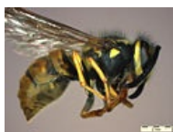
Vespula vulgaris Stereo Microscope