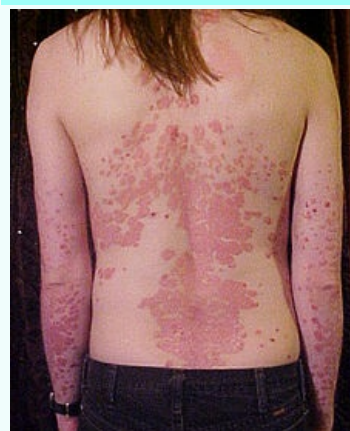
Psoriáza na zádech