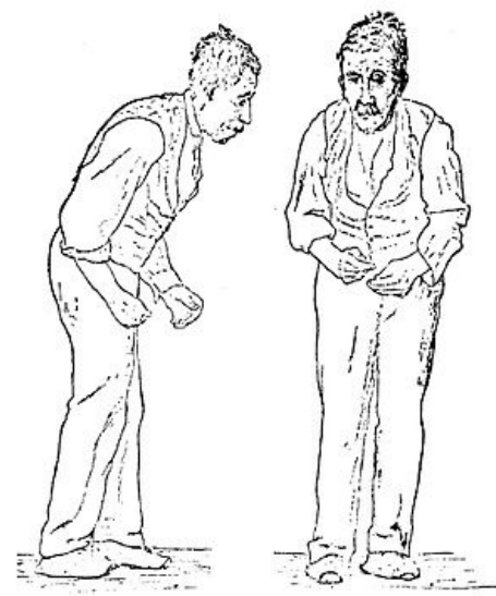
Náčrt postoj nemocného