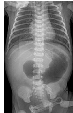
Pancreas anulare na RTG břicha