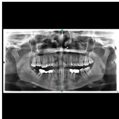
Periapikální cista v dolní čelisti v pravém polovině rentgenového snímku.

Většinou nebolestivá, sliznice nad ní nezměněná. Pomalý expanzivní růst, někdy vestibulárně nacházející zduření alveolárního výběžku, které má zpočátku tuhou konzistenci. V pokročilém stavu dochází k vyklenutí a deformaci anatomického tvaru. Palpačně ohraničený nádorovitý útvar krytý kůží nebo sliznicí, který má fluktuující charakter nebo v místě největšího vyklenutí se prolamuje. Dupuytrenův příznak - při výrazném ztenčení kosti lze palpací vyvolat krepitace, které vznikají elastickým převalováním stěny cysty, konvergentní postavení korunek v důsledku roztlačení kořenů sousedních zubů, patologické fraktury (vzácně).