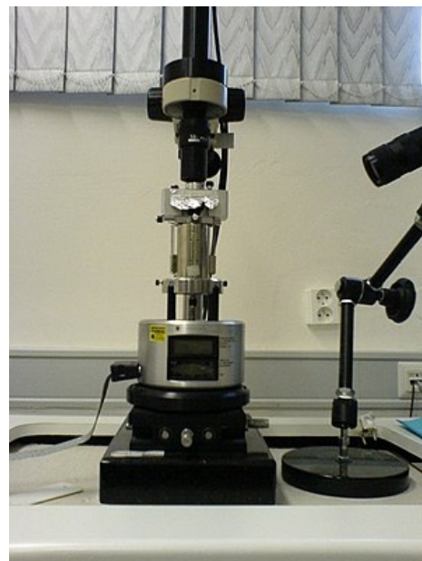
Mikroskop atomárních sil MM AFM Nanoscope IIIa výrobce Veeco Instruments

Mikroskopie atomárních sil (AFM – atomic force microscopy neboli SFM – scanning force microscopy) je typ mikroskopie skenovací sondou. Umožňuje zobrazit struktury s atomárním rozlišením za pomoci mechanického pohybu sondy po povrchu zkoumaného materiálu. Rozlišení je až v řádu nanometrů a je tedy možno vidět detaily až na úrovni atomů. Mikroskopie atomárních sil se používá k trojrozměrnému zobrazování povrchů.