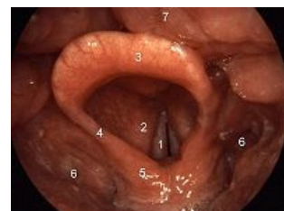
Fyziologický laryngoskopický obraz