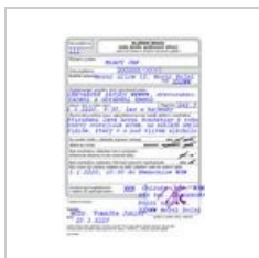
Formular-hlaseni-... 544 × 776; 186 KB

The following 12 files are in this category, out of 12 total.