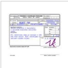
Zadanka-schvale... 646 × 528; 96 KB