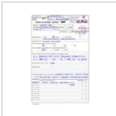
Poukaz-ustavni-O... 615 × 939; 206 KB