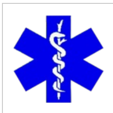
Mladi praktici log... 370 × 362; 76 KB