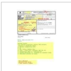
Lázně-návrh.jpg 650 × 928; 158 KB