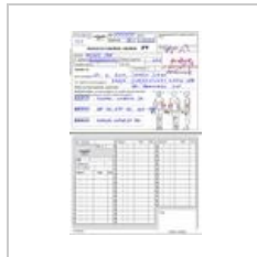
Tiskopis-FT.jpg 643 × 982; 204 KB