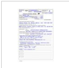
Poukaz-domaci-p... 657 × 977; 218 KB