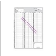
Poukaz-domaci-p... 657 × 959; 163 KB