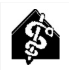
Logo-VPL.png 73 × 83; 1 KB