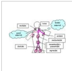
Uzlinové oblasti.jpg 326 × 194; 25 KB