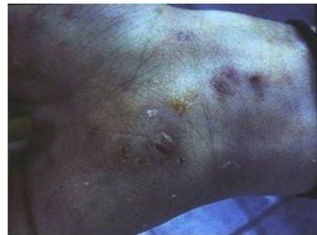
Proudová známka – zápěstí