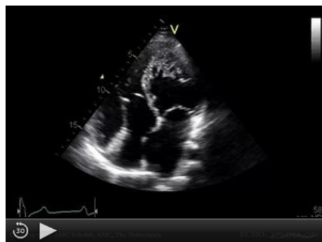
K diagnostice se využívá echokardiografie