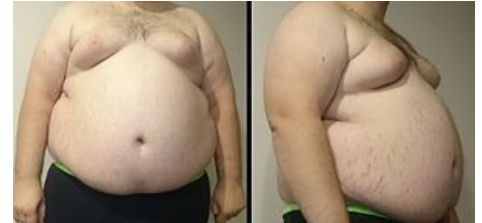
Centrální obezita a strie na břiše