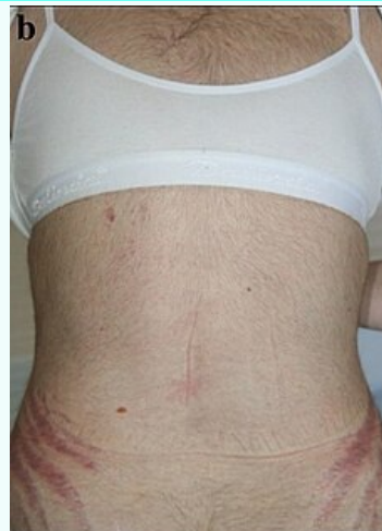
Zvýšené ochlupení a zarudlé strie typické u Cushingova syndromu