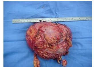
15 cm veliký nádor nadledviny