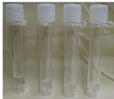
Fyziologický čirý bezbarvý likvor