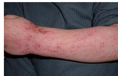
Atopický ekzém na předloktí 5letého dítěte