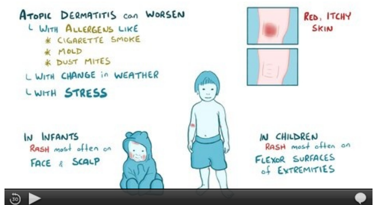
Video v angličtině, definice, patogeneze, příznaky, komplikace, léčba.

U dětí s atopickým ekzémem se uvádí prevalence potravinové alergie v různých studiích v rozmezí 20-80 %. Mezi potravinovými alergenů dominují vejce, kravské mléko, sója a pšeničná mouka. Přibližně 1/3 dětí ztrácí potravinovou alergii po 1-2 letech vyhýbání se potravinovému alergenů, záleží to však na druhu alergenů. [4]