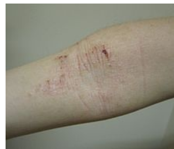
Atopický ekzém v loketní jamce

K posouzení závažnosti a rozsahu atopické dermatitidy slouží různé skórovací systémy, např. EASI, SCORAD. [11]