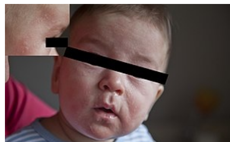
kožní příznaky alergie

Vztah času rozvoje ABKM a množství vypitého mléka a obvyklých klinických manifestací ukazuje tabulka č.2.