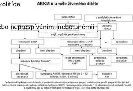
Schéma 2: Uměle živené dítě s ABKM (151)

Od tohoto členění a způsobu výživy (kojení, umělá výživa) se odvíjí diagnostický algoritmus – schéma 1 a 2.